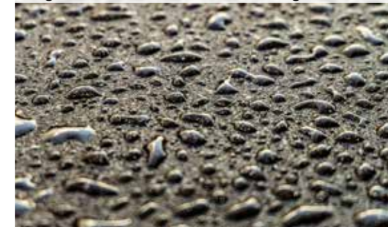
Ergebnisse des Wasserdurchlässigkeitstests

Die signifikante Verringerung der Durchlässigkeit ist noch viele Jahre nach der Anwendung nachweisbar, was zeigt, dass RHiNOPHALT® einen dauerhaften Schutz für Asphaltflächen bietet.