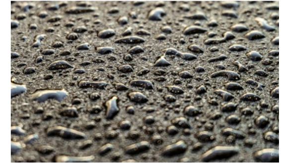
Ergebnisse des Wasserdurchlässigkeitstests

Die signifikante Verringerung der Durchlässigkeit ist noch viele Jahre nach der Anwendung nachweisbar, was zeigt, dass RHiNOPHALT® einen dauerhaften Schutz für Asphaltflächen bietet.