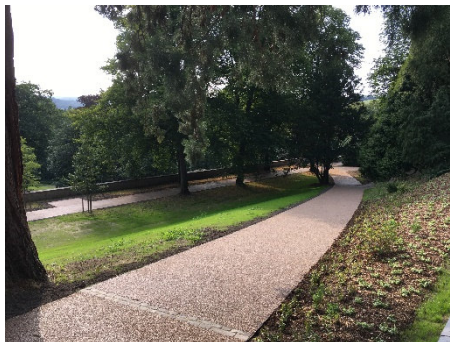
KUTTER Grip EP Flex / EP Dur wasserdurchlässig

sind Oberflächenbehandlungen aus Reaktionsharz (OB-RH) auf der Bindemittelbasis von 2-komponentigen Reaktionsharzen für Asphalt- und Betonflächen nach ZTV BEB-StB sowie der TL BEB-StB, TP BEB-StB bzw. des Merkblattes für griffigkeitsverbessernde Maßnahmen an Verkehrsflächen aus Asphalt. Aufgrund der schnellen und nachhaltigen Bauweise von KUTTER Grip EP Flex / EP Dur , lässt sich die wieder griffige und verkehrssichere Verkehrsfläche nach einer kurzen Bauzeit sofort unter voller Verkehrsbelastung nutzen.