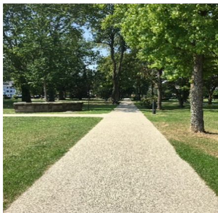
KUTTER Grip EP Flex / EP Dur Naturnahe Gestaltung

Ebenso kann durch die Verwendung von KUTTER Grip EP Flex / EP Dur die Aufheizung von innerstädtischen Verkehrsflächen, wie zum Beispiel von dunklen Asphalt- oder Betonoberflächen und damit auch der gesamten angrenzenden Umgebung, erheblich reduziert werden.